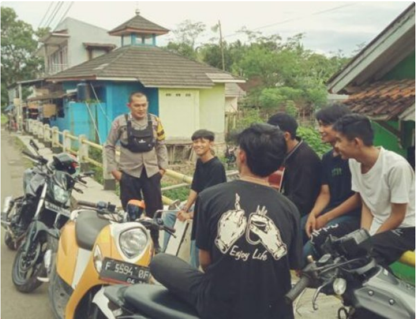
Polsek Cireunghas Polres Sukabumi Kota

Kota Sukabumi – Polres Sukabumi Kota Polda Jawa Barat – Polsek Cireunghas melaksanakan kegiatan dialogis dengan para pengemudi angkutan umum di jalan sempur, Selasa (30/1/24). Kegiatan ini bertujuan untuk menyampaikan himbauan